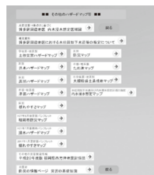
その他のハザードマップ等

いますし、現「まっぶ」は令和3年1月1日のものであり以後は更新されていません。また、山間部は集落部分しか表示がありません。その点は特にご注意ください。それからハザードマップですが、いろいろな種類や見方がありその数も多くなってきたので、『福岡市webまっぶ』以外の分は「その他のハザードマップ等」として別ページにまとめまし