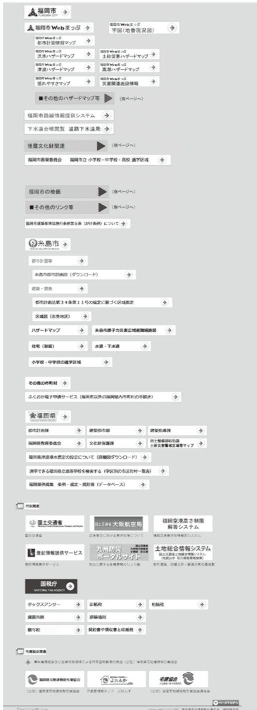
▼調査・業務に役立つ便利リンク集TOP画面

いますし、現「まっぶ」は令和3年1月1日のものであり以後は更新されていません。また、山間部は集落部分しか表示がありません。その点は特にご注意ください。それからハザードマップですが、いろいろな種類や見方がありその数も多くなってきたので、『福岡市webまっぶ』以外の分は「その他のハザードマップ等」として別ページにまとめまし